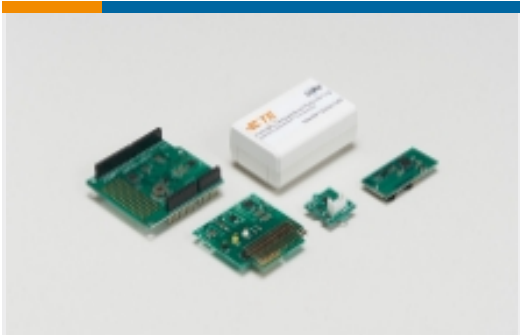
传感器开发板和评估套件(3)