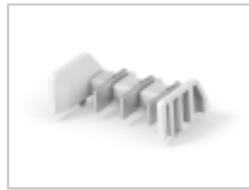
TWO-PIECE POKE-IN, 5MM HEADER, 3 POS