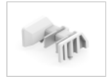
TWO-PIECE POKE-IN, 5MM HEADER, 2 POS