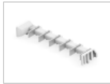
TWO-PIECE POKE-IN, 8MM HEADER, 6 POS