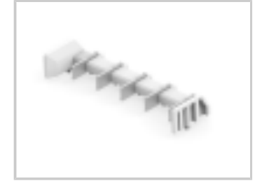
TWO-PIECE POKE-IN, 8MM HEADER, 5 POS