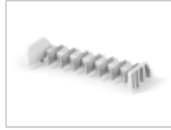
TWO-PIECE POKE-IN, 5MM HEADER, 7 POS