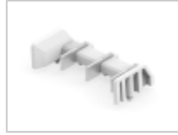
TWO-PIECE POKE-IN, 8MM HEADER, 3 POS