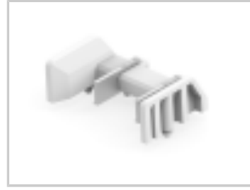
TWO-PIECE POKE-IN, 8MM HEADER, 2 POS