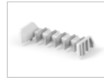
TWO-PIECE POKE-IN, 5MM HEADER, 5 POS