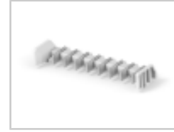
TWO-PIECE POKE-IN, 5MM HEADER, 8 POS