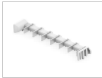
TWO-PIECE POKE-IN, 8MM HEADER, 7 POS