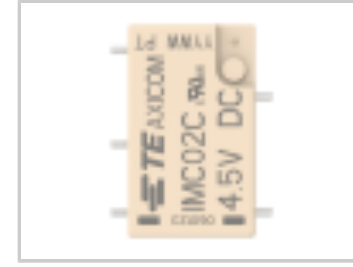
IMC02CGR=IM RELAY 140mW 4.5V 1CO HDV