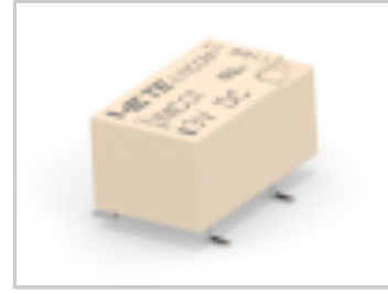
IMC01GR=IM RELAY 140mW 3V 1CO