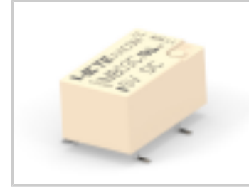
IMB03CGR=IM RELAY 140mW 5V HDV