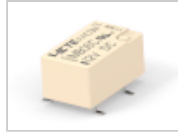
IMB06CGR=IM RELAY 140mW 12V HDV