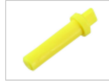
SEALING PLUG, SZ 16 CAVITY