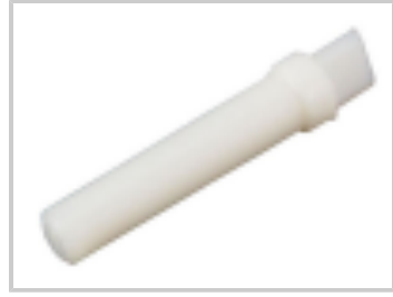
SEALING PLUG, SZ 20 CAVITY