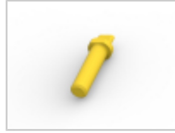
AMPSEAL16 SEALING PLUG SIZE16