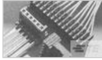
PLUG HE14 IDC 90 5 P AWG 26