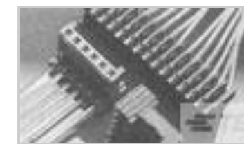
PLUG HE14 IDC 90 4 P AWG 26