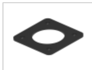
ECONOSEAL, FLANGE GASKET