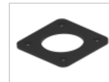
ECONOSEAL, FLANGE GASKET