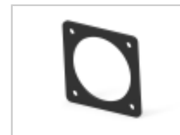
ECONOSEAL, FLANGE GASKET