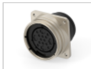
CMC RECEPT ASSY, SIZE 28-16