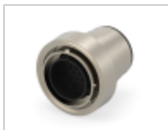
CMC PLUG ASSEMBLY, SZ 28