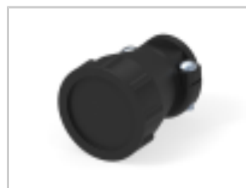
17 SIZE CPC STD CLAMP