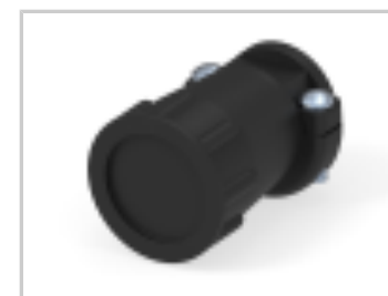
13 SIZE CPC STD CLAMP