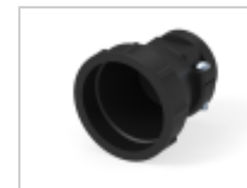
23 SIZE CPC STD CLAMP