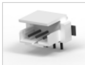
CT BOX HDR V SMT 3P O /TAPE NAT