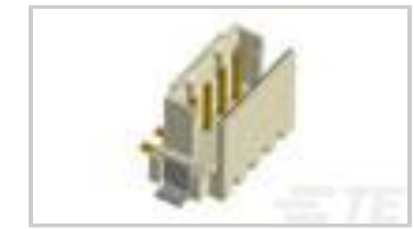
CT BOX HDR V SMT 7P O /TAPE NAT