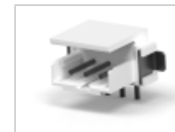
CT BOX HDR V SMT 3P O /TAPE NAT