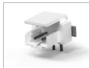
CT BOX HDR V SMT 2P O /TAPE NAT