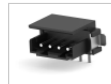
CT BOX HDR V SMT 4P O /TAPE BLA