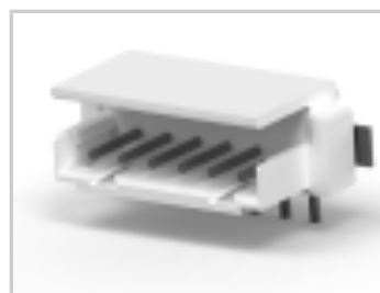
CT BOX HDR V SMT 6P O /TAPE NAT