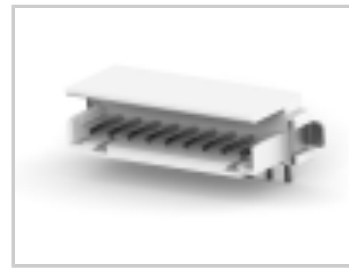
CT BOX HDR V SMT 9P O /TAPE NAT