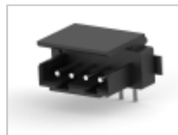
CT BOX HDR V SMT 4P O /TAPE BLA