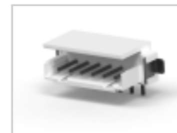
CT BOX HDR V SMT 6P O /TAPE NAT