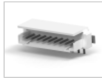
CT BOX HDR V SMT 9P O /TAPE NAT