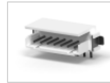
CT BOX HDR V SMT 7P O /TAPE NAT