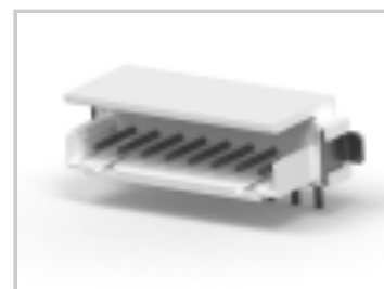
CT BOX HDR V SMT 8P O /TAPE NAT