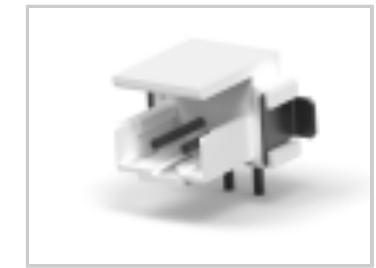
CT BOX HDR V SMT 2P O /TAPE NAT