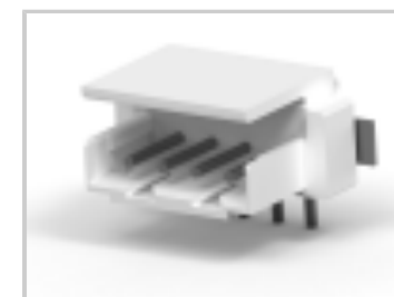
CT BOX HDR V SMT 4P O /TAPE NAT