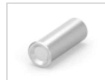
SOCKET,MIN-SPR SN SER-5