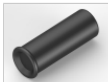
SOCKET,MIN-SPR SN-AU SER-5