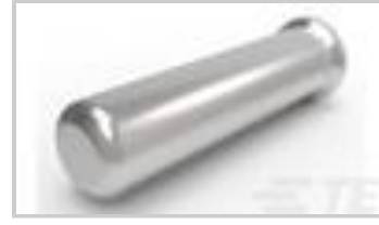
SOCKET, MIN-SPR AU SER-5