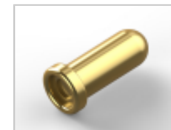
RCR AU-SPR AU-CUP 018- 040