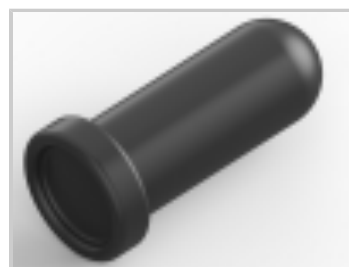
RCR AU-SPR SN-CUP 018-040