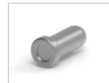
RCR SN-SPR SN-CUP 018-040