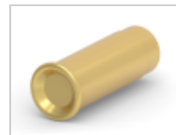
SOCKET,MIN-SPR AU SER-5