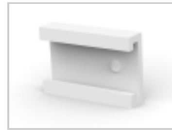
06P MTA100 COVER F/T