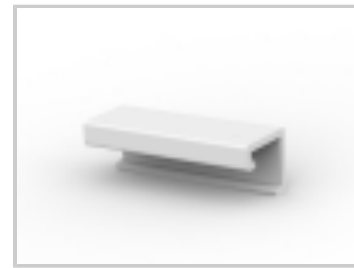
10P MTA100 COVER