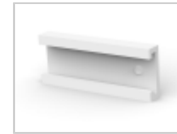
10P MTA100 COVER F/T