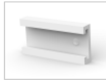
08P MTA100 COVER F/T