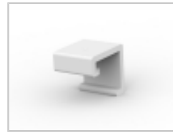
03P MTA100 COVER