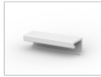
12P MTA100 COVER