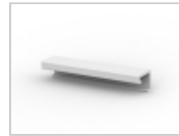
18P MTA100 COVER