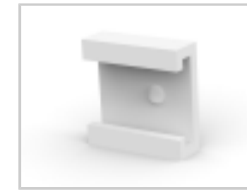
04P MTA100 COVER F/T