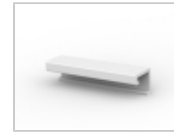
14P MTA100 COVER