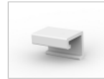
05P MTA100 COVER