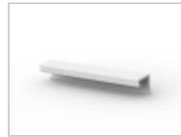
20P MTA100 COVER