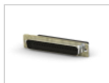
PLUG ASSY SIZE 4