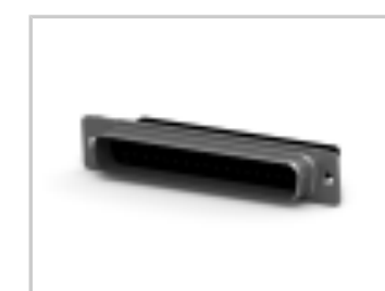
HDP-20,PLUG,SIZE 4, 37 POSN