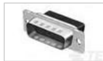
HDP-20,PLUG,SIZE 4, 37 POSN, CL