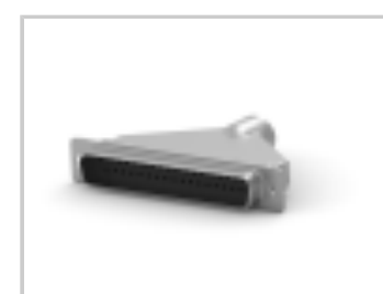
KIT,HDP-20,OVRMLD,PLUG, SIZE 4,