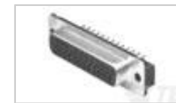
15 RCPT ACT PIN/MS MED SCRLK