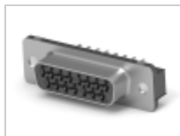
15 RCPT ACT PIN/MS MED INSRT