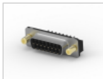
15 RCPT ACT PIN/MS MED SCRLK