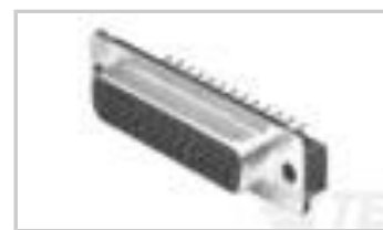
15 RCPT ACT PIN/MS MED STD