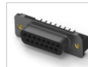
15 RCPT SP/FMS INSRT