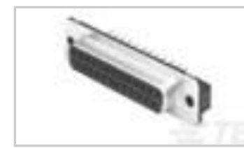
15 RCPT SP/FMS BRDLK