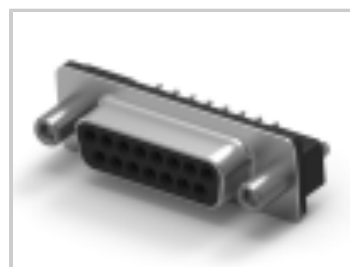
15 RCPT SP/FMS SCRLK