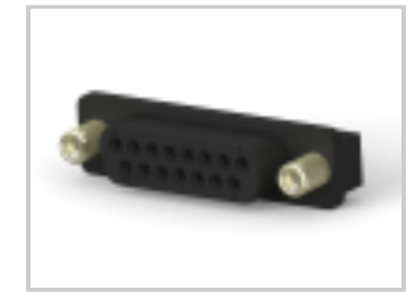
HD-20 RCPT 15P VERT THD INS