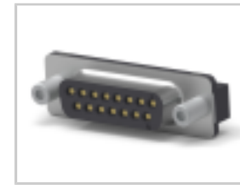
15 RCPT SP/FMS SCRLK