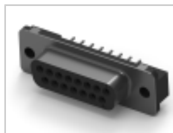
15 RCPT SP/FMS STD