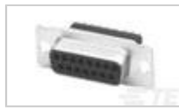
15 RCPT SP/MS CNUT