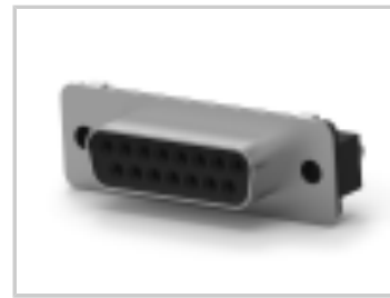
15 RCPT SP/FMS BRDLK