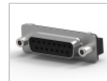
15 RCPT SP/FMS SCRLK