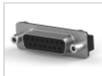
15 RCPT SP/FMS SCRLK