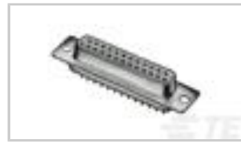
V42254A2216B215=SUB D FEDERLEI