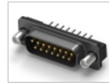
15 PLUG SP/FMS INSRT