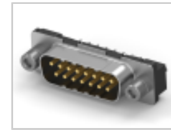
15POS.HD20 PLUG ASS'Y