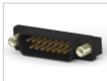
HD-20 PLUG 15P VERT FFSCRLK