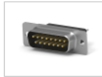
15 PLUG SP/MS STD