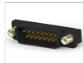
HD-20 PLUG 15P VERT FFSCRLK