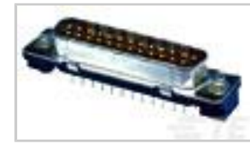
15 PLUG SP/FMS STD