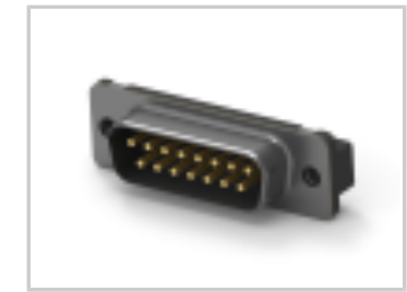
15 PLUG SP/FMS INSRT