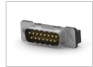
15 PLUG SP/FMS SCRLK