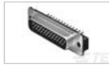
15 PLUG ACT PIN/MS (SL)