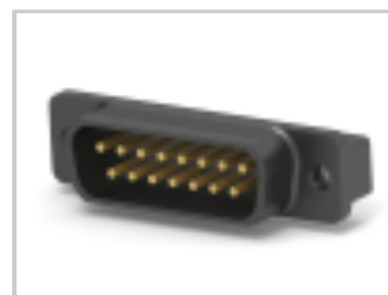
HD-20 PLUG 15P VERT