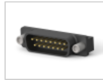
15 PLUG SP/AP SCRLK