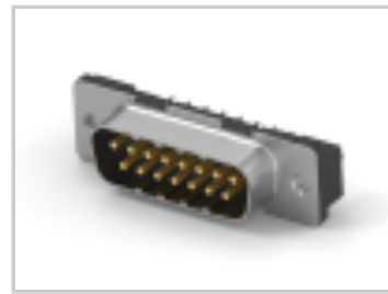
15POS.HD20 PLUG ASS'Y