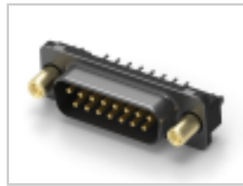
15 PLUG SP/FMS (IN,SL)