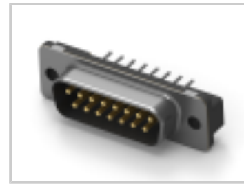
15 PLUG SP/FMS STD