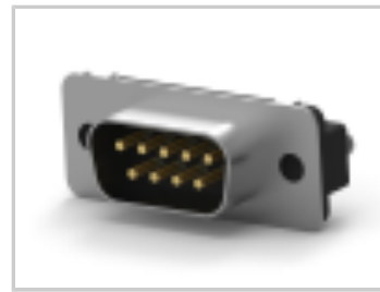
09 PLUG SP/FMS BRDLK