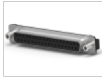
09 PLUG SP/FMS SCRLK