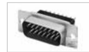
09 PLUG SP/FMS BRDLK