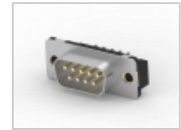
09 PLUG ACT PIN/MS MED INSRT