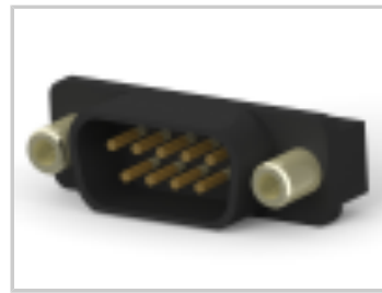
HD-20 PLUG 9P VERT FFSCRLK