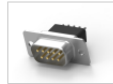
09 PLUG SP/MS STD