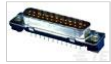
9P.HDP20 PLUG ASSY