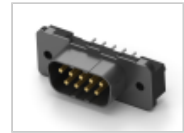
9P.HDP20 PLUG ASSY