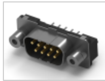
9POS.HD20 PLUG ASSY