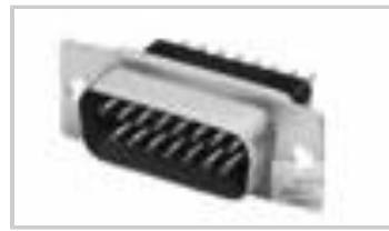
09 PLUG SP/MS STD