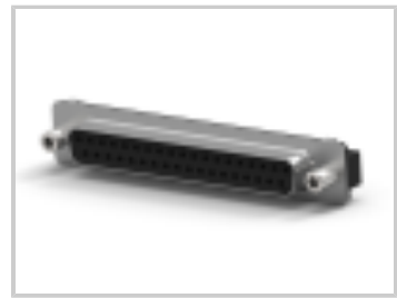
09 PLUG SP/FMS SCRLK