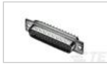
V42254A2216C209=SUB D STIFTLI