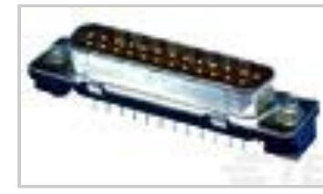
9P.HDP20 PLUG ASSY