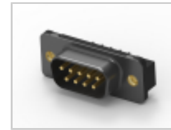
09 PLUG SP/FMS INSRT