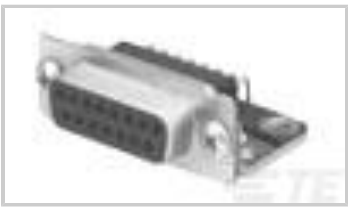
25P RA MSFL 318 RCPT