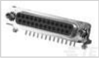
25 MSFL RCPT RA 318 (IN, FM,BL)