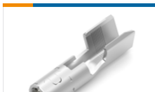
TE 产品编号2208669-3 8MM HV, CONTACT, ASSY