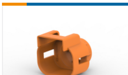
TE 产品编号2103013-3 CABLE SEAL RETAINER, SIZE 2, OR, HVA280