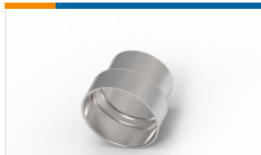
TE 产品编号2177090-3 STEEL, OUTER FERRULE, 8MM HV, 25SQMM