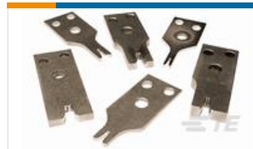
TE 产品编号1-1633961-2 CRIMPER, INSULATION F PREMIUM