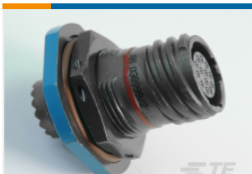
TE 产品编号YDTS24Z25-19PNV001 RECP ASSY