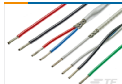
TE 产品编号2823013001 44A0211-8-9