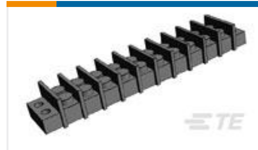
TE 产品编号1-1546306-0 10P.374" DR BARRIER STRIP