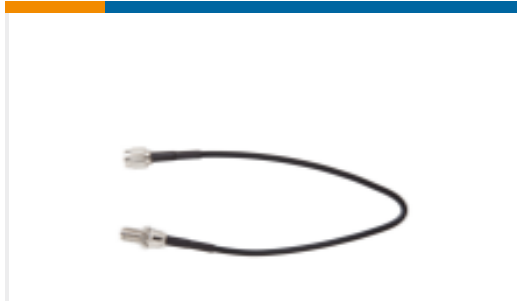
TE 产品编号CSA-RPSM-216-RSFB RP-SMA to RP-SMA 216mm RG174