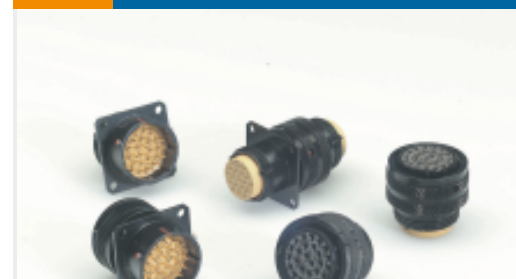
TE 产品编号ZPF000000000096107 FDPA 50-8-3A-PN-K-A246