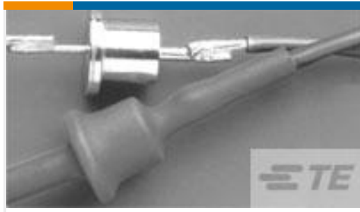
TE 产品编号5677664002 RNF-3000-12/4-2-SP