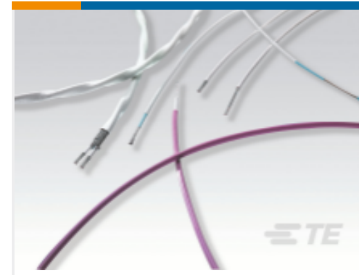
TE 产品编号CA4001-000 Hookup Wire: Tin Coated Copper Wire, 24 AWG