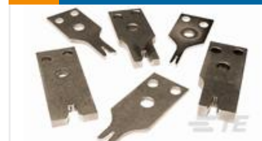
TE 产品编号1-653846-6 DRAHTCRIMPER KP