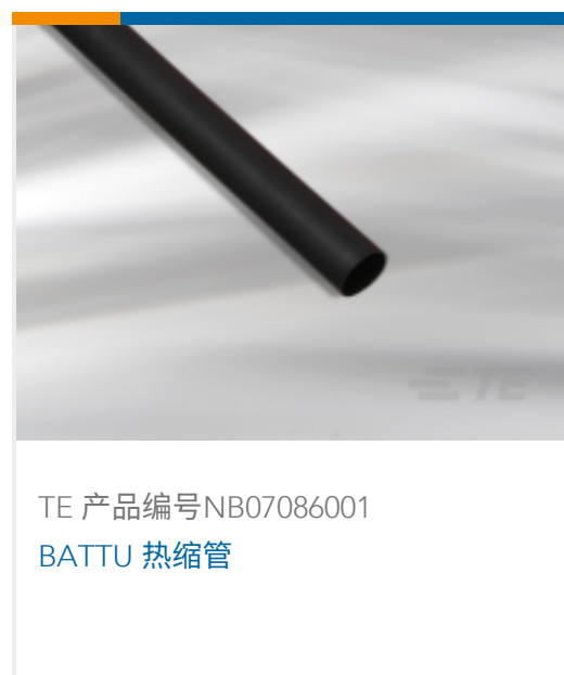
TE 产品编号NB07086001 BATTU 热缩管