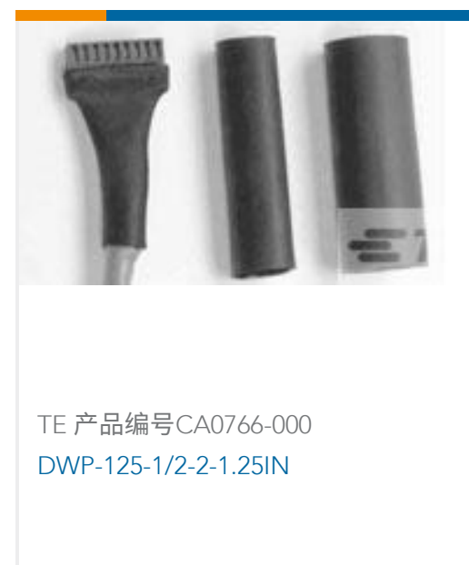
TE 产品编号CA0766-000 DWP-125-1/2-2-1.25IN