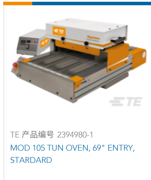
TE 产品编号 2394980-1 MOD 105 TUN OVEN, 69" ENTRY, STANDARD