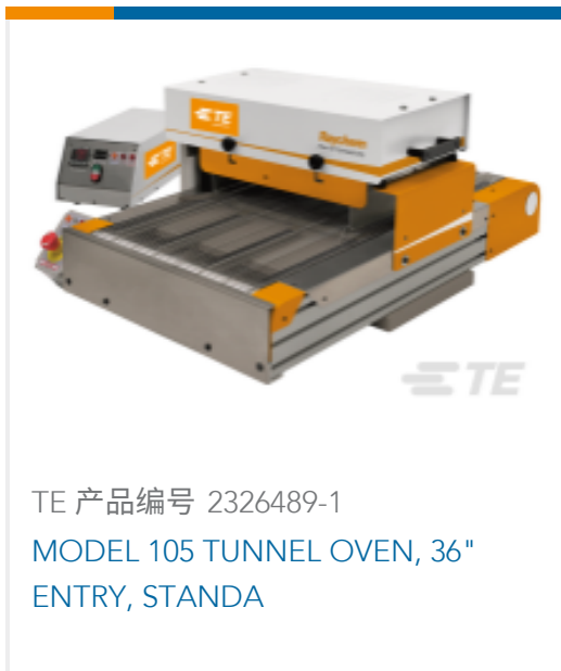
TE 产品编号 2326489-1 MODEL 105 TUNNEL OVEN, 36" ENTRY, STANDA