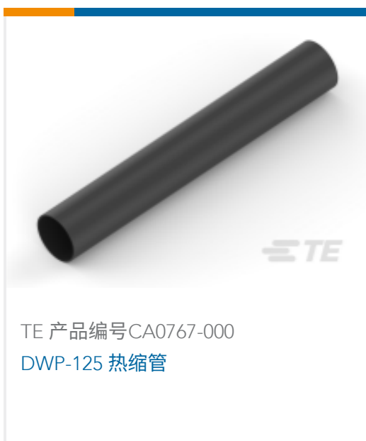
TE 产品编号CA0767-000 DWP-125 热缩管