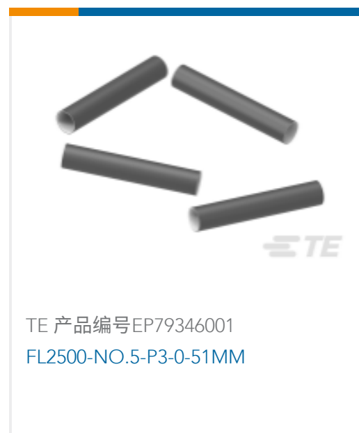
TE 产品编号EP79346001 FL2500-NO.5-P3-0-51MM