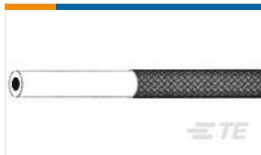
TE 产品编号F345203001 RAY-101-3.0(100)