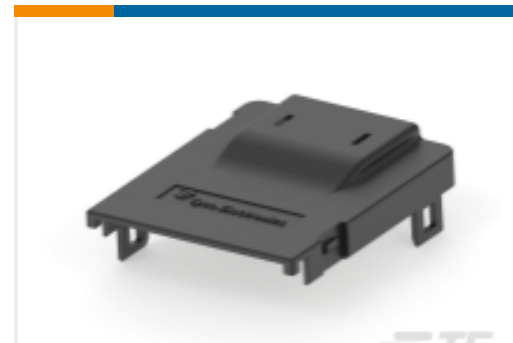
TE 产品编号1986186-1 Strain Relief,20 Posn,D3000 Dynamic, 2