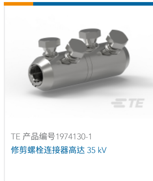
TE 产品编号1974130-1 修剪螺栓连接器高达 35 kV