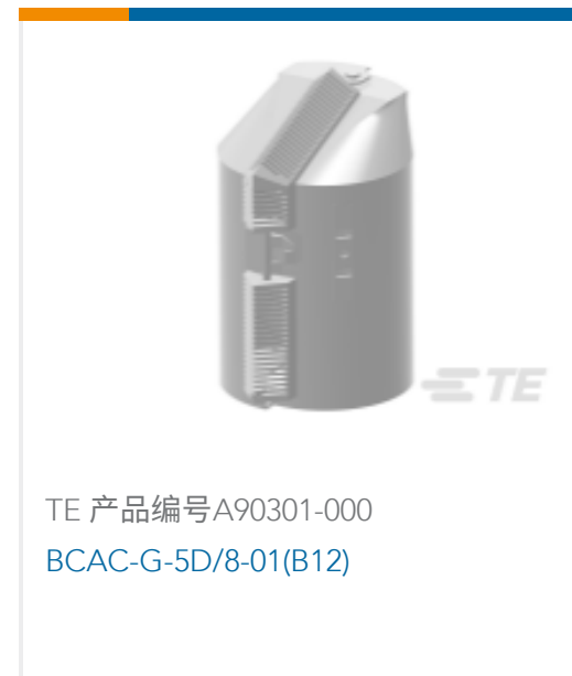
TE 产品编号A90301-000 BCAC-G-5D/8-01(B12)