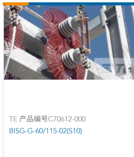
TE 产品编号C70612-000 BISG-G-60/115-02(S10)