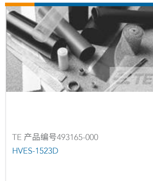
TE 产品编号493165-000 HVES-1523D