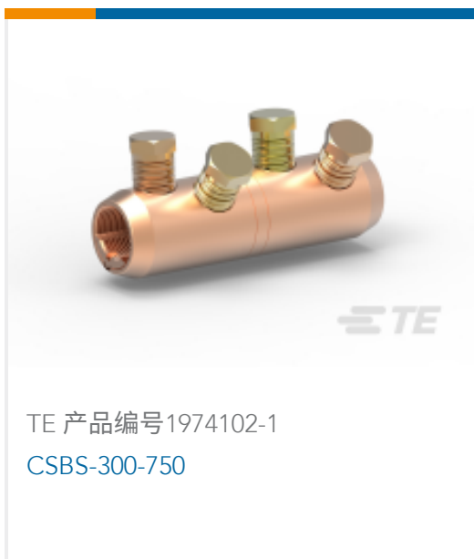
TE 产品编号1974102-1 CSBS-300-750