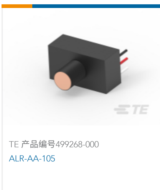
TE 产品编号499268-000 ALR-AA-105