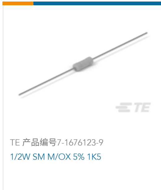
TE 产品编号7-1676123-9 1/2W SM M/OX 5% 1K5