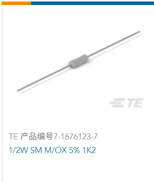
TE 产品编号7-1676123-7 1/2W SM M/OX 5% 1K2