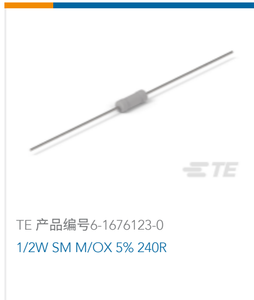
TE 产品编号6-1676123-0 1/2W SM M/OX 5% 240R