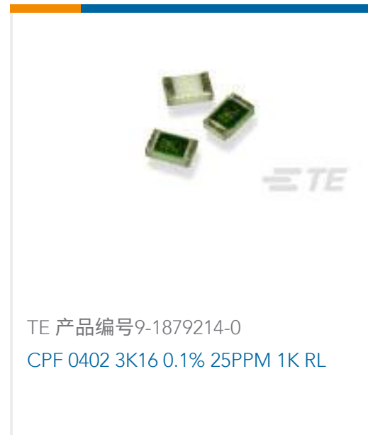
TE 产品编号9-1879214-0 CPF 0402 3K16 0.1% 25PPM 1K RL