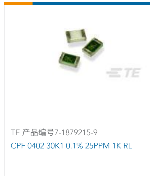
TE 产品编号7-1879215-9 CPF 0402 30K1 0.1% 25PPM 1K RL