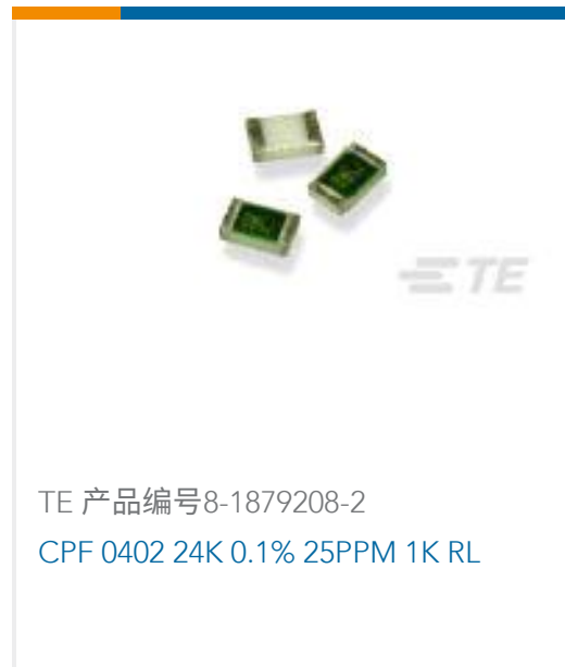
TE 产品编号8-1879208-2 CPF 0402 24K 0.1% 25PPM 1K RL