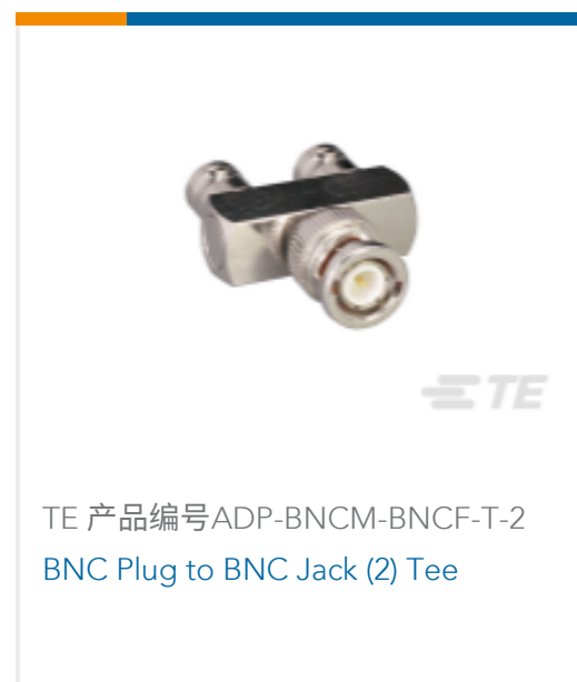
TE 产品编号ADP-BNCM-BNCF-T-2 BNC Plug to BNC Jack (2) Tee