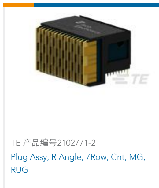
TE 产品编号2102771-2 Plug Assy, R Angle, 7Row, Cnt, MG, RUG