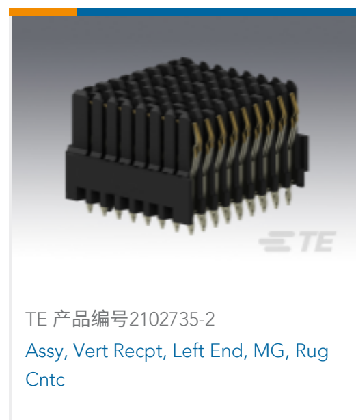
TE 产品编号2102735-2 Assy, Vert Recpt, Left End, MG, Rug Cntc