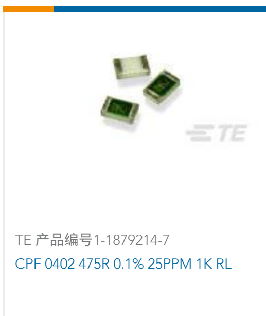
TE 产品编号1-1879214-7 CPF 0402 475R 0.1% 25PPM 1K RL