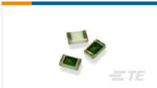
TE 产品编号1-1879222-7 CPF 0603 28R 0.1% 25PPM 1K RL