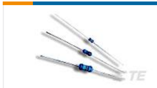
TE 产品编号2-1879026-6 YR1 0.1% 17R8