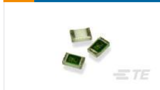
TE 产品编号9-1879221-7 CPF 0603 16R9 0.1% 25PPM 1K RL