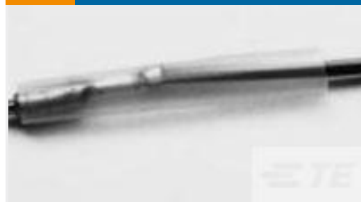
TE 产品编号CV25894001 RW-175-E-1/2-X-SP