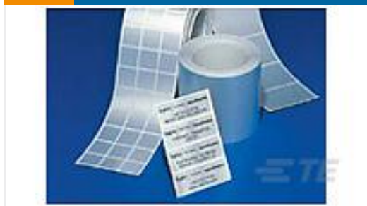
TE 产品编号F07599-000 MP-508254-5-8A