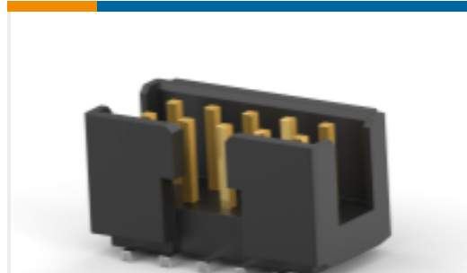
TE 产品编号1-2373376-0 10P,2MM,SHRD HDR,DRVT,SMD,0.1 AU,TB