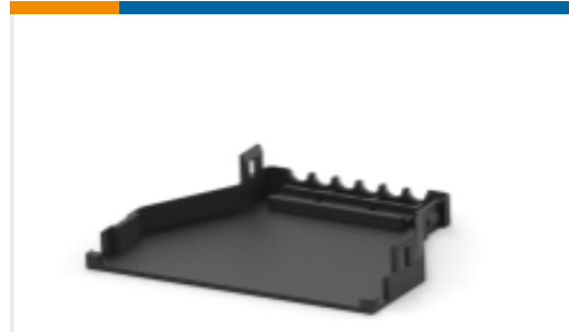
TE 产品编号1776695-1 Strain Relief, D5200, Dynamic