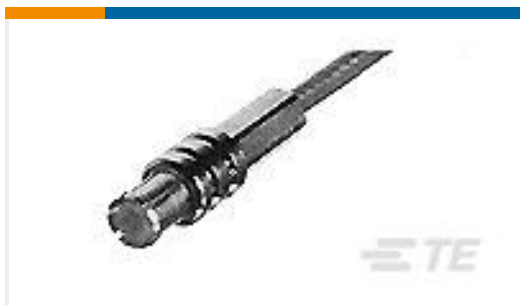
TE 产品编号1060875-2 MCX CABLE PLUG, CRIMP ATTACH