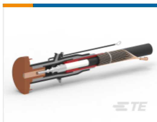
TE 产品编号EN3707-011 RSSS-525B