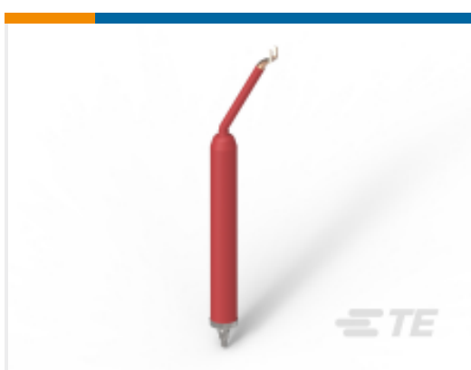
TE 产品编号211513-000 RDA-21