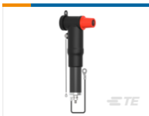
TE 产品编号CS3111-000 RSTI-CC-68SA1810