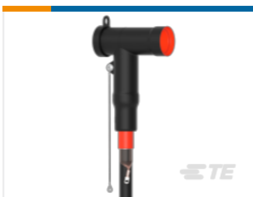
TE 产品编号CM0009-005 屏蔽式可分离连接器 1250 A