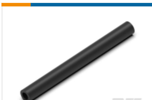
TE 产品编号CN5946-000 EN-CGAT-6/2-0-1200