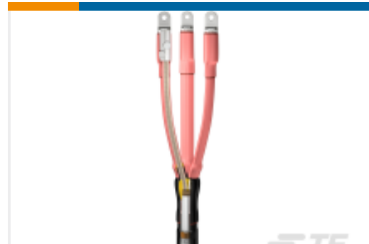
TE 产品编号A31452-070 GUST-12/70-120/800-L12