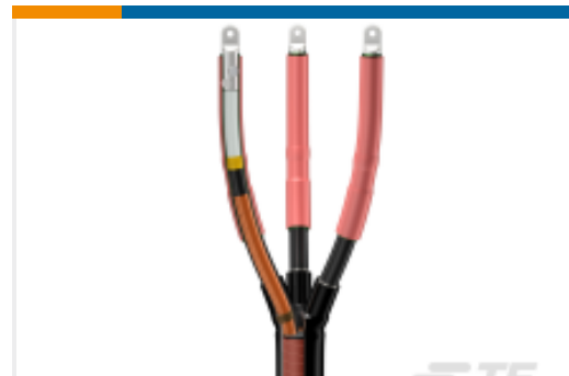
TE 产品编号E92435-063 POLT-12D/3XIH1