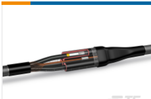
TE 产品编号A69078-064 POLJ-12/3X70-150