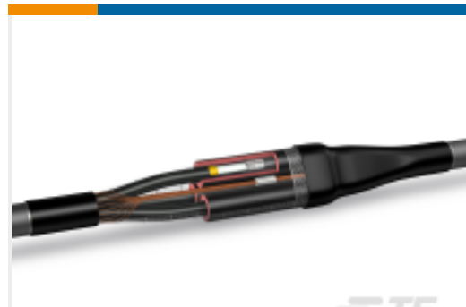
TE 产品编号D11309-070 POLJ-12/3X25-70