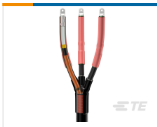
TE 产品编号E92435-063 POLT-12D/3XIH1