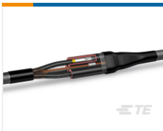
TE 产品编号D11309-070 POLJ-12/3X25-70