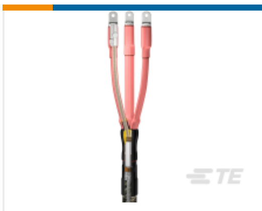
TE 产品编号C47372-064 GUST-12/25-50/800