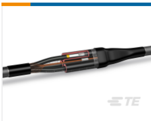
TE 产品编号A69078-064 POLJ-12/3X70-150