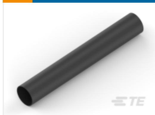
TE 产品编号EM7626-000 ES-CAP-HW-NO.2-0-45MM-ST