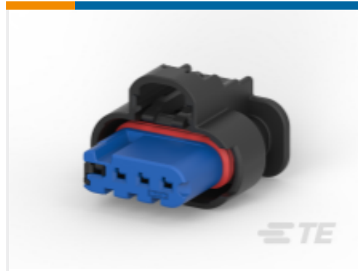
TE 产品编号2203773-1 4POS, MCON 1.2 CB REC 1p TL SEALED