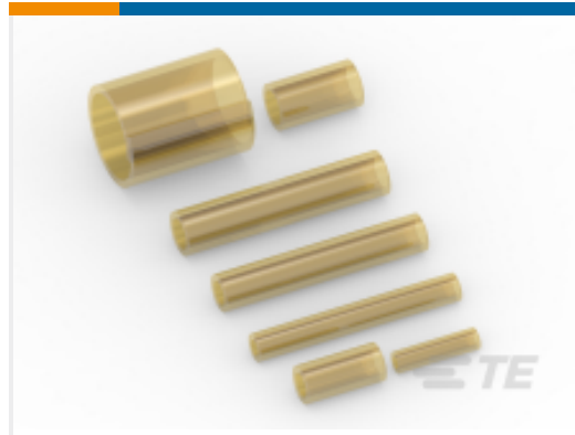
TE 产品编号7251716003 TSAS-NR504-X-15MM