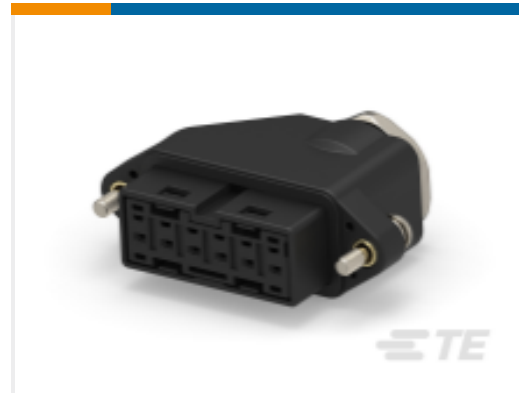
TE 产品编号2345834-1 NEW MOTOR CONN REC KIT. PF