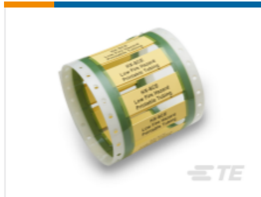
TE 产品编号D67949-000 HX-SCE Low Fire Hazard Sleeves