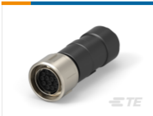
TE 产品编号ZPF000000000137369 FICHE F 13PTS T.07 CLAV.N + CTS + RD + T