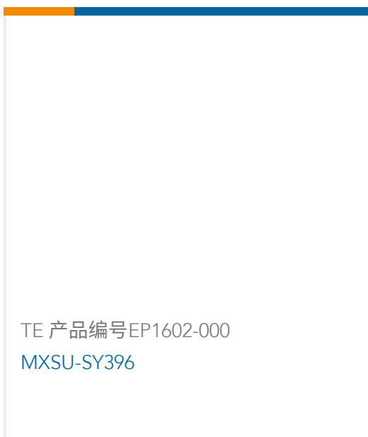
TE 产品编号 EP1602-000 MXSU-SY396