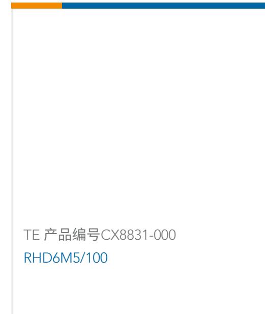
TE 产品编号 CX8831-000 RHD6M5/100