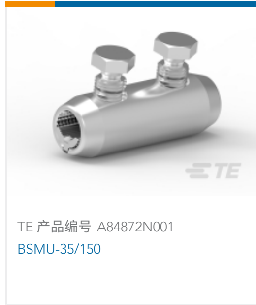
TE 产品编号 A84872N001 BSMU-35/150