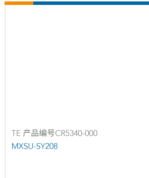
TE 产品编号 CR5340-000 MXSU-SY208