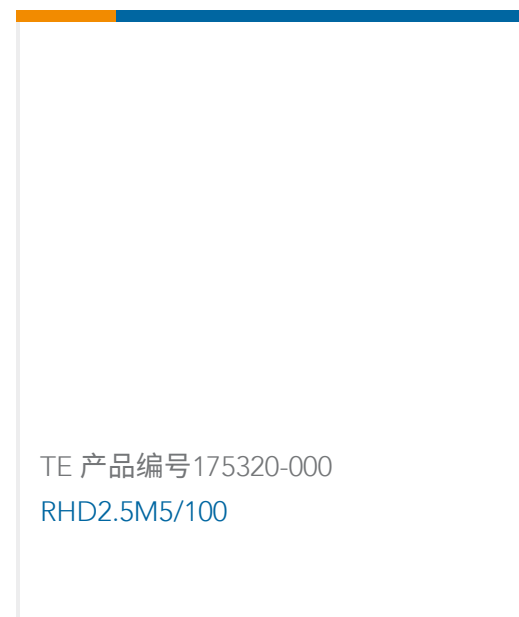
TE 产品编号 175320-000 RHD2.5M5/100