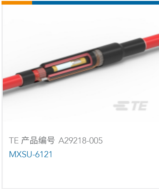
TE 产品编号 A29218-005 MXSU-6121