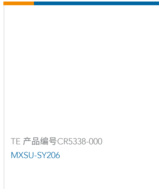
TE 产品编号 CR5338-000 MXSU-SY206