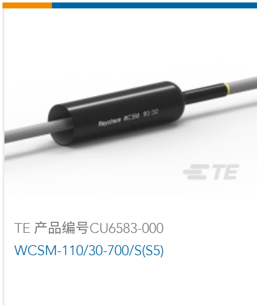
TE 产品编号 CU6583-000 WCSM-110/30-700/S(S5)