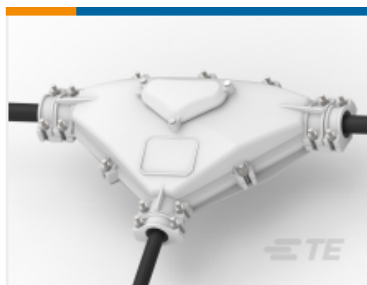
TE 产品编号407812-000 HMY-701-EM