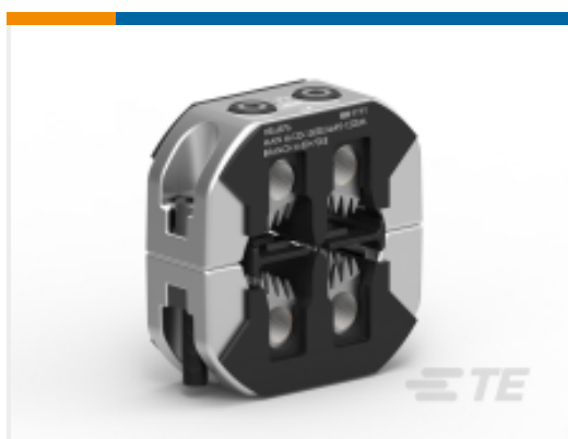
TE 产品编号A67317-000 HEL-6877.1