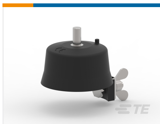
TE 产品编号D13378-000 LVA-280B-BS