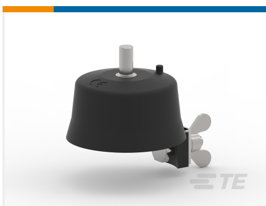
TE 产品编号D42517-000 LVA-280B-CS