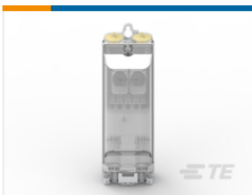
TE 产品编号543072-000 EKM-2050-2D1/FIX-5S