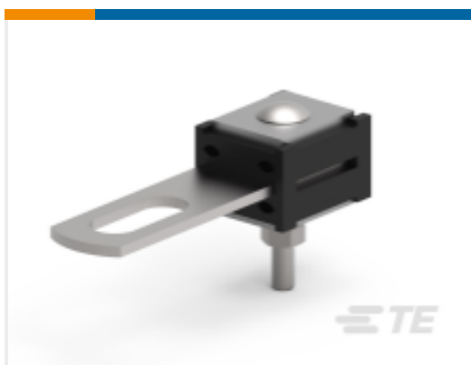
TE 产品编号705580-000 HEL-3591