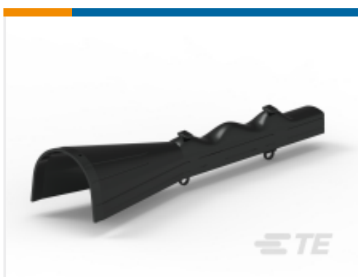
TE 产品编号CY4158-000 BCIC-TEN-01(B3)