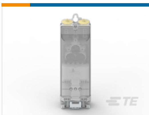
TE 产品编号669434-000 EKM-2050-3D1-5S/U-E3