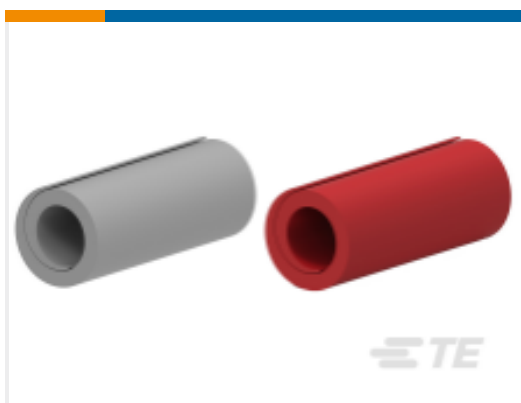
TE 产品编号BM7953-000 MVCC-10/.40(S30)