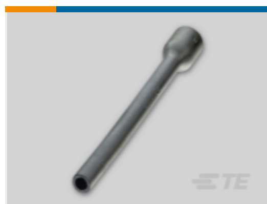
TE 产品编号604252-000 小尺寸热缩护套：聚合物成型，有嘴，直形