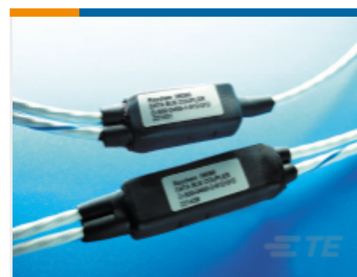
TE 产品编号CS0757-000 D-500-0455-2-613-032