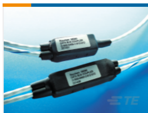
TE 产品编号CS0756-000 D-500-0455-1-613-056