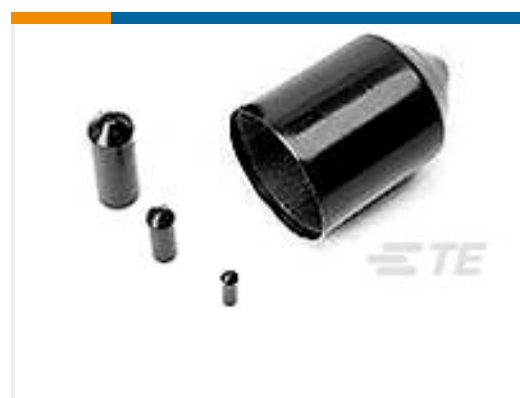
TE 产品编号843377-000 101A021-4-0