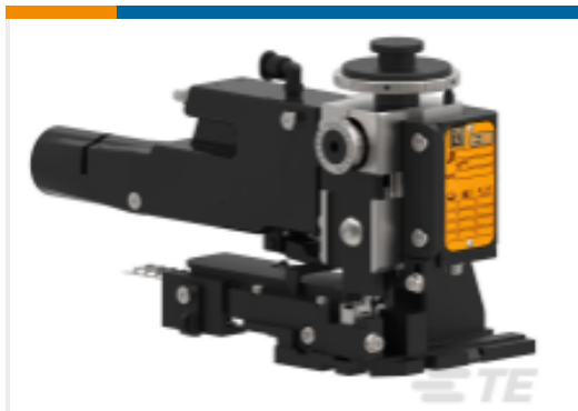
TE 产品编号5-2151493-2 OCEAN_2.0-APPLICATOR-S-055F0720