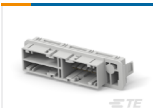
TE 产品编号1718176-3 24pos MDS .63 header 90deg