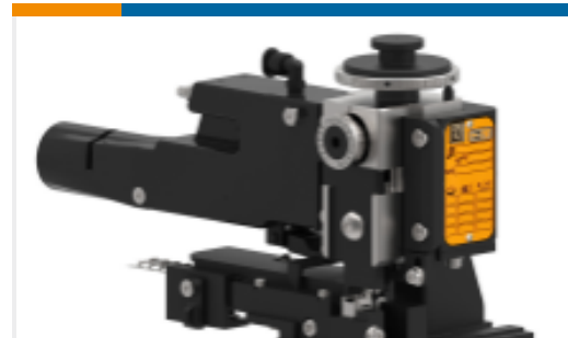
TE 产品编号5-2151177-2 OCEAN-2.0-APPLICATOR-S-110F2600