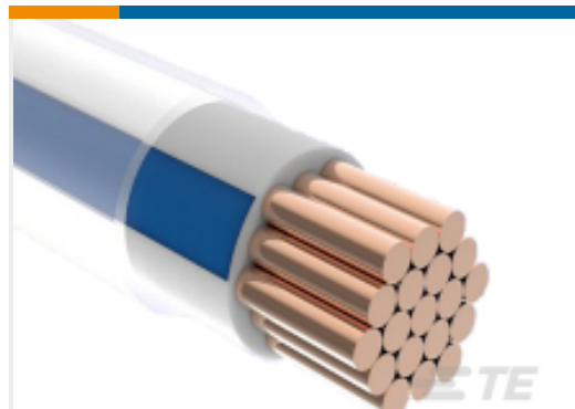
TE 产品编号D166023001 ACW0219-0.75-82L(NS)