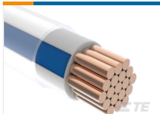
TE 产品编号C624723001 ACW0219-1.50-64(NS)