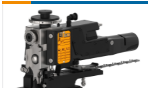
TE 产品编号2836900-2 OCEAN_2.0_Applicator-S-037F