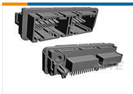
TE 产品编号953621-7 48pos MDS .63 header 90deg sld.