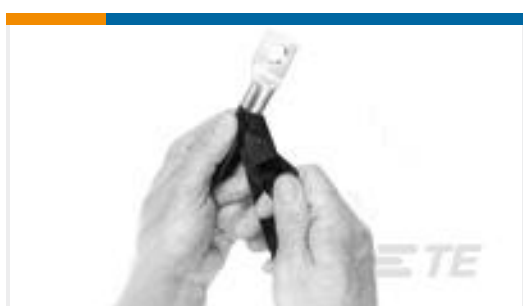
TE 产品编号605262-2 FUSION TAPE, 2" X .020" X 30FT