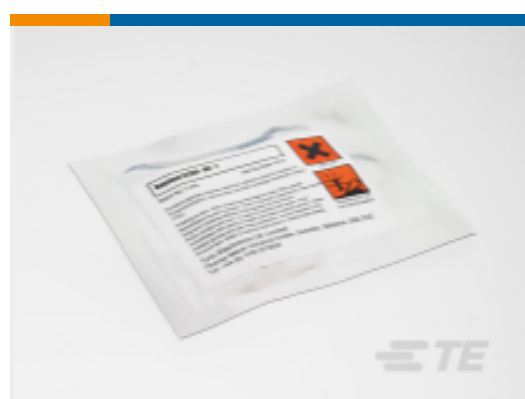
TE 产品编号 889431-000 S1264-KIT-1