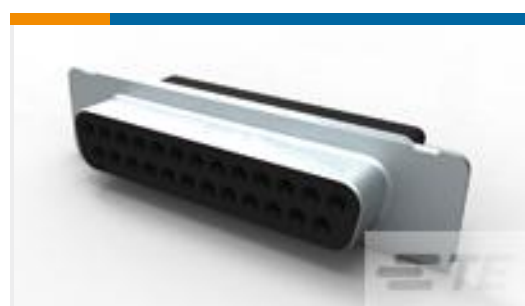
TE 产品编号5205207-1 HD RECPT ASSY SIZE 3