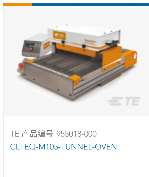
TE 产品编号 955018-000 CLTEQ-M105-TUNNEL-OVEN