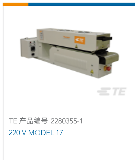
TE 产品编号 2280355-1 220 V MODEL 17