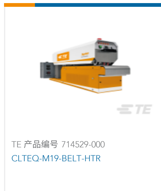
TE 产品编号 714529-000 CLTEQ-M19-BELT-HTR