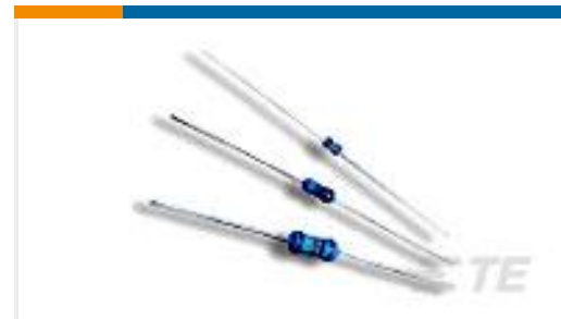
TE 产品编号2-1879026-6 YR1 0.1% 17R8