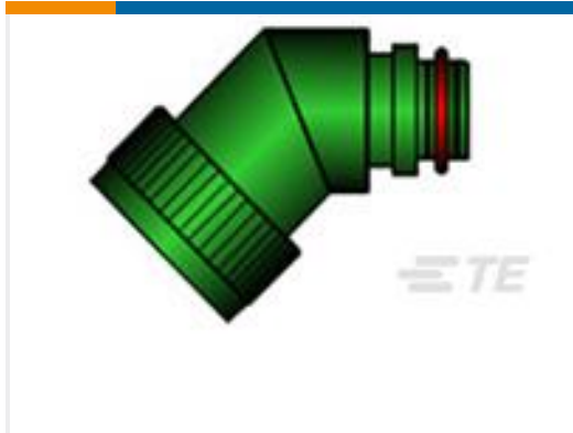
TE 产品编号A05444-000 TXR41AB45-2008BI