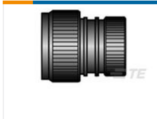
TE 产品编号CV5805-000 HEX40-AC-00-23-A13-2