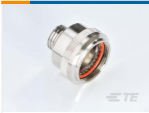
TE 产品编号70H1-19-16-1-B 70H1-19-16-1-B