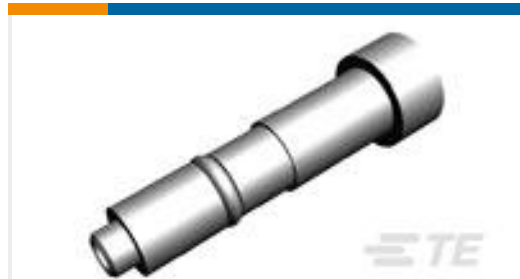
TE 产品编号1588908-2 PRO BEAM JR, FRRL KIT, PC 125 SEALED