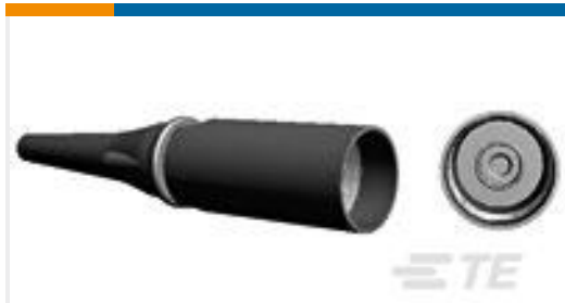
TE 产品编号1918931-5 CABLE ADPT, PLUG, HA, 5.7mm, PRO BEAM Jr