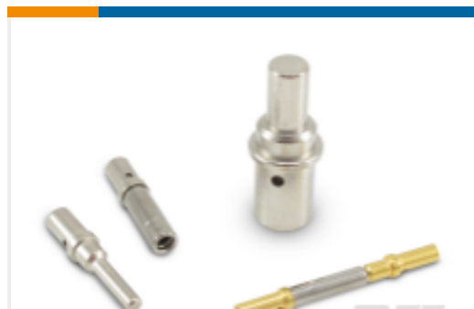
TE 产品编号0462-209-16141 DEUTSCH Solid Contacts