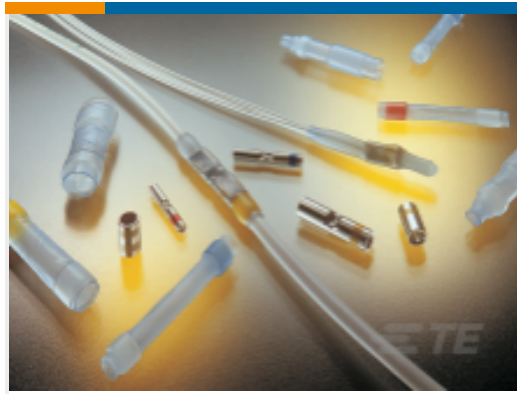
TE 产品编号625291-000 D-128-0024