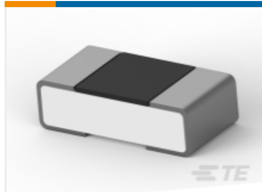
TE 产品编号7-2176362-1 RQ 0402 215R 0.1% 10PPM 5K RL