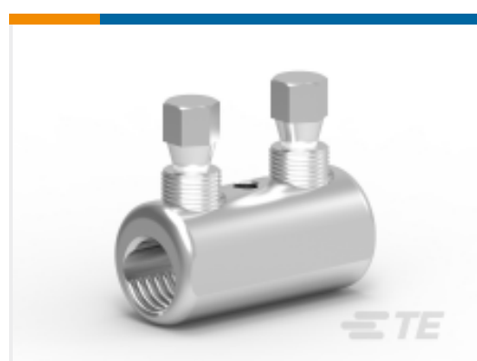
TE 产品编号2107421-2 BSLU-35/95