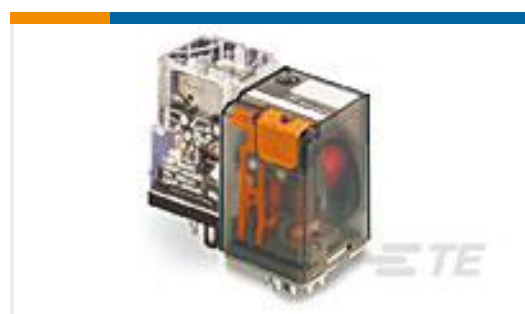
TE 产品编号8-1393091-9 MT323110