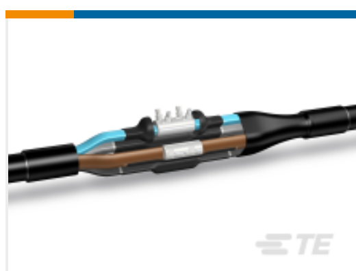
TE 产品编号CY1555-000 LJSM-5X01.5-006