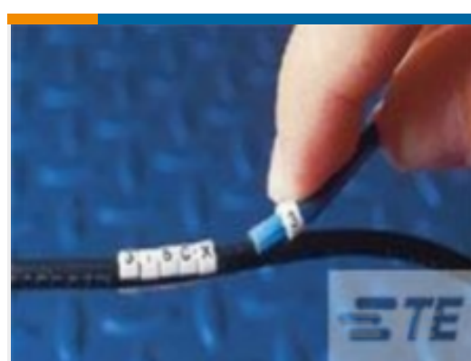
TE 产品编号9-1768044-8 STD12Y-0