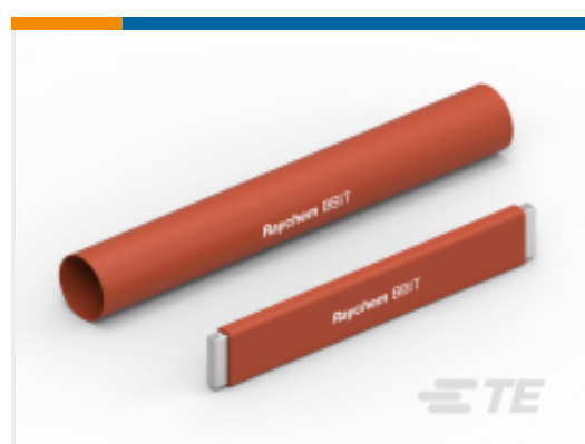
TE 产品编号568659-000 BBIT-25/10-A/U-4(S25)