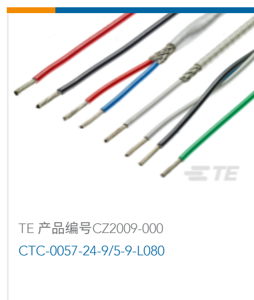
TE 产品编号CZ2009-000 CTC-0057-24-9/5-9-L080