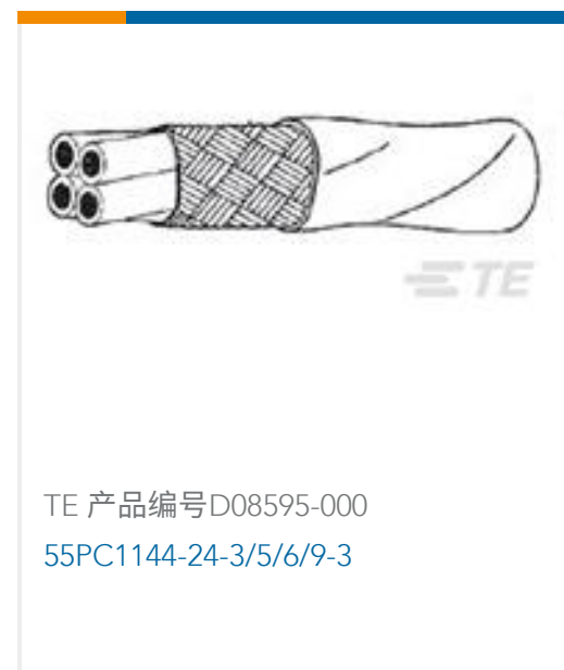
TE 产品编号D08595-000 55PC1144-24-3/5/6/9-3