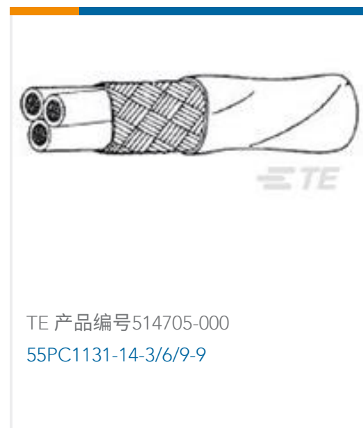
TE 产品编号514705-000 55PC1131-14-3/6/9-9