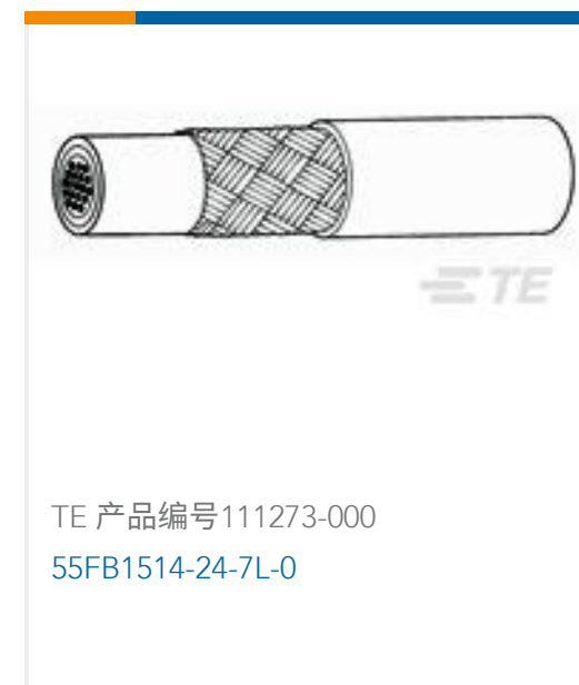
TE 产品编号111273-000 55FB1514-24-7L-0