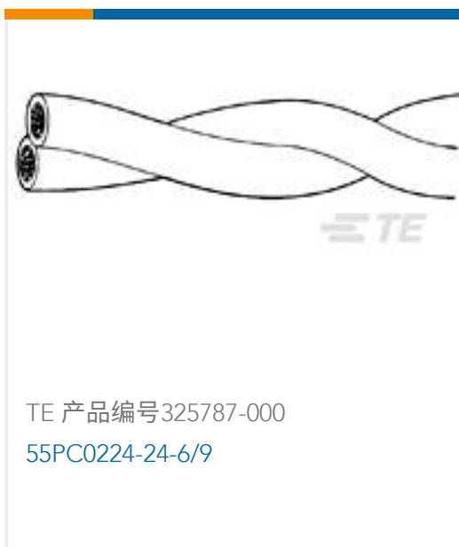
TE 产品编号325787-000 55PC0224-24-6/9