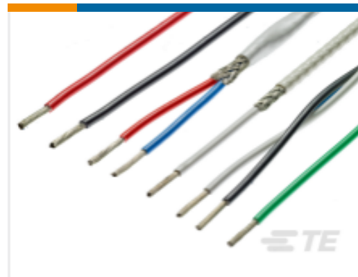
TE 产品编号 2823013001 44A0211-8-9