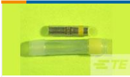
TE 产品编号 650076-000 D-436-38