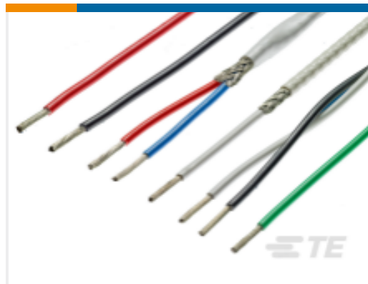
TE 产品编号 2611473001 44A0111-12-54