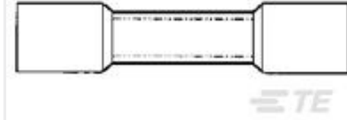
TE 产品编号55845-1 #8 PRE-INSUL SEALED SPLICE